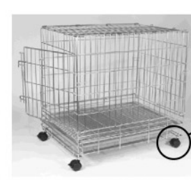
オプションのキャスターを付けたステンレス製ゲージ(SSD)

4 4つの角全てにナットをはめたら完成です。振動により、ナットがゆるむことがありますので時々点検してください。