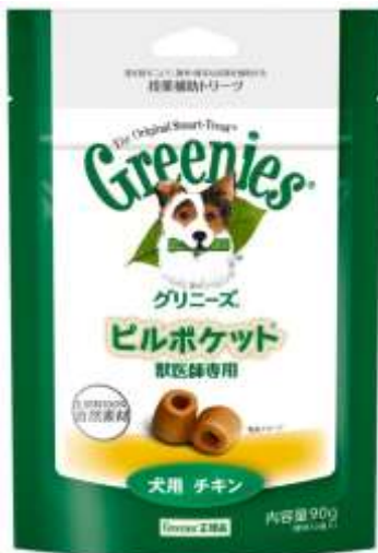
犬用 チキン 標準30個入