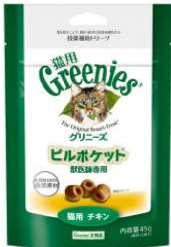
猫用 チキン 標準45個入