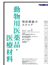
獣医療総合 カタログVol.1

N's drive スキンケアシャンプーに関する詳しいご案内は「 獣医療総合カタログ vol.1（動物用医薬品・医療材料） 」P.992か、弊社 WEBサイト をご覧ください。