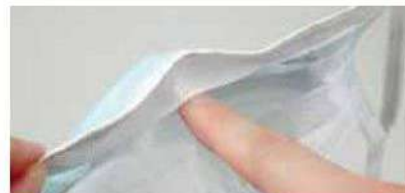
呼吸を抑えて眼鏡が曇りにくい、メッシュのアンチフォグ加工