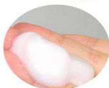
普通の泡 (当社製品)