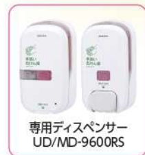
専用ディスペンサー UD/MD-9600RS