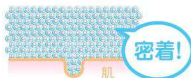
ホイップウォッシュ 無香の泡