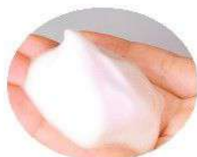
ホイップウォッシュ 無香の泡

超微細で濃密な泡が、 肌に吸い付くように密着。 手洗い時の摩擦による刺激を抑え、 やさしく洗い上げます。