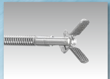
把持鉗子「セルメンHK1.2」